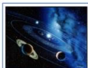
Макет солнечной системы с планетарными орбитами