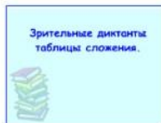
Зрительные диктанты таблицы сложения. Таблица сложения и вычитания 1-20 Урок SMART Notebook