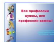
Классный час "Все профессии нужны, все профессии важны!" Урок SMART Notebook