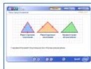
Типы треугольников Связанный с управлением